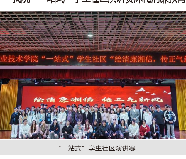
“一站式”学生社区演讲赛

近年来，学校以“一站式”学生社区为核心载体，通过演讲比賽、清廉书画展、廉洁知识竞赛等系列活动，构建多维度清廉教育体系，推动清廉理念深度融入校园文化。下一步，“一站式”学生社区将继续聚焦学生需求，创新清廉教育形式，为培养时代新人夯实思想基础。