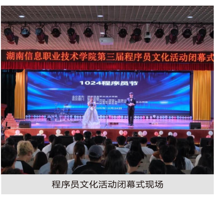
程序员文化活动现场