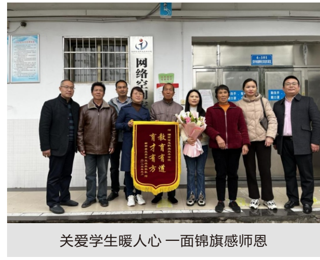
关爱学生暖人心 一面锦旗感恩师

师德师风警示教育敲响警钟，身边违规违纪典型案例筑牢思想防线，“以课助学”等问题专项整治营造育人环境，多点发力营造风清气正的良好校园生态。“一月一讲”“湘信辅导员会讲”等特色活动，搭建起辅导员展示的舞台与沟通学习的平台，切实提升“讲话”艺术，增强处理学生事务的实战能力。以湖南省辅导员素质能力大赛为抓手，