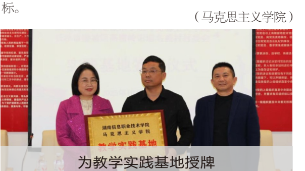
为教学实践基地授牌