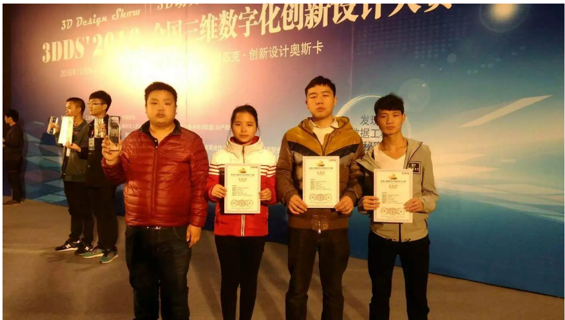
图 1 全国 3D 大赛获“一等奖”

2016 年 11 月在校期间，成立湖南智能科技有限公司，任 CEO，（公司目前盈利近一万，客户人群涵盖全国各地）