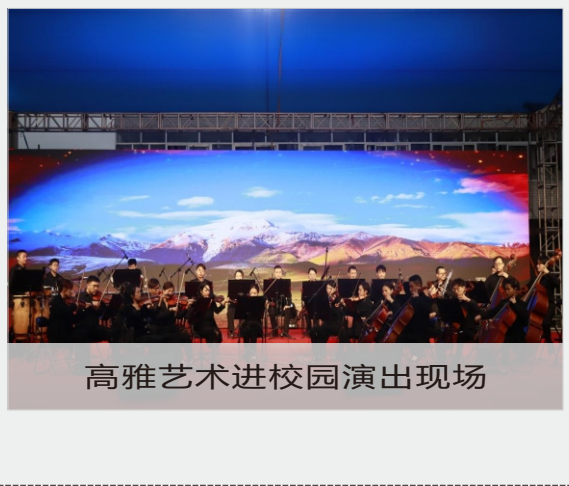
高雅艺术进校园演出出现场

本次音乐会的圆满成功，不仅使学院全体师生近距离领略音乐的艺术魅力，更在潜移默化中陶冶了情操，提升了艺术素养，为校园文化生活注入了浓墨重彩的一笔。未来，学院将继续引进优质教育资源，打造更多“有内涵、有温度”的文化品牌活动，让高雅艺术真正成为滋养青年学子成长的深厚沃土。（院团委）