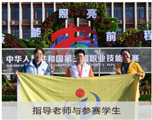
指导教师与参赛选手

商务软件解决方案赛项在三天内设置六大场次，涵盖需求分析与设计、数据分析、桌面及移动应用程序开发、软件测试、技术文档编写汇报六大模块，全面考查选手的综合素质与领先优势。未来，学院将继续秉持“以赛促学、以赛促教、以赛促改”理念，强化校企深度合作，培育更多具有创新精神和实践能力的高素质信息技术人才，为我国信息技术产业的持续发展注入新的活力。（软件学院）