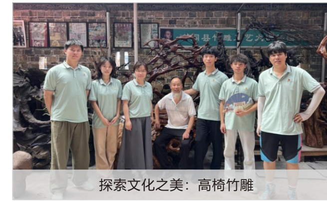
探索文化之美：高椅竹雕