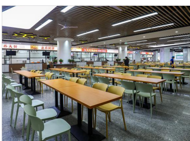
翻新后的北院学生食堂

安全守护，“硬核”升级不留死角。安全是校园最美的底色，在这个暑假，校园里打响了一场场安全“攻坚战”。学院在教学楼加建消防应急楼梯，让逃生通道更加畅通无阻。同时，对校内消防器材进行维修保养，新增消防设施，进一步织密校园消防安全防护网。