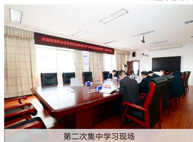
第二次集中学习现场