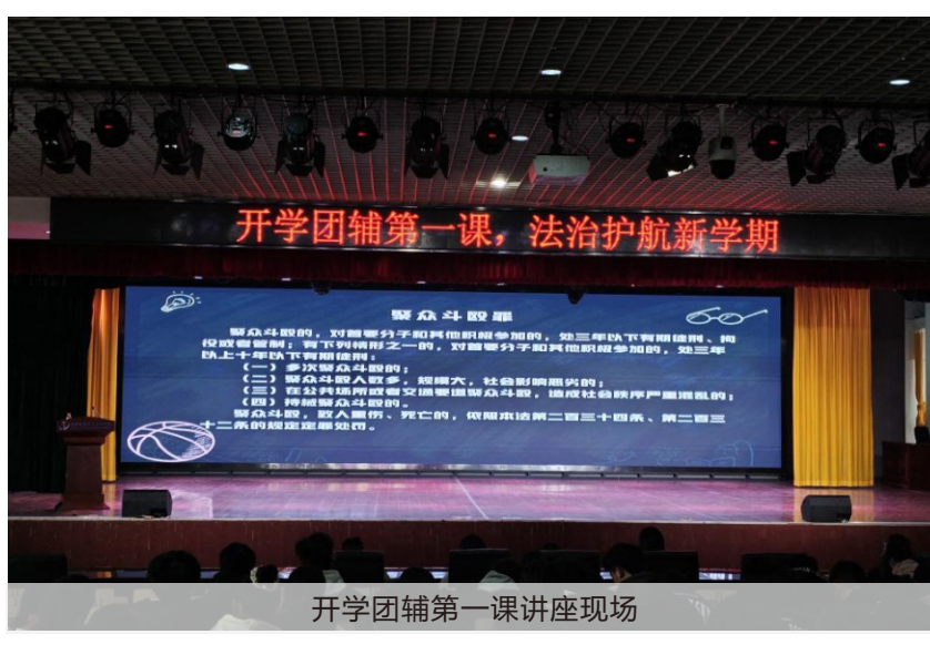
开学团辅第一课讲座现场