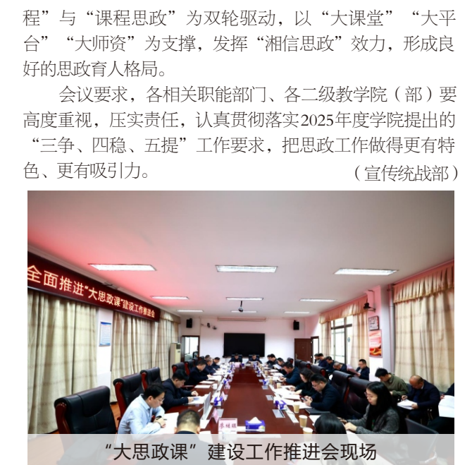
“大思政课”建设工作推进会现场

会议强调，要压实责任推进进度。梳理好政策导向，把对表谋在前抓落实，保质保量完成；保障思政队伍建设和提升思政工作活力和吸引力。要对标要求列出时间表、加快进度，制定推进时间表；及时汇报，共商解决问题举措；抓住教智机遇，有质有量搭平台用平台。要聚焦重点难点工作。全面推进“大思政课”建设，以“思政课